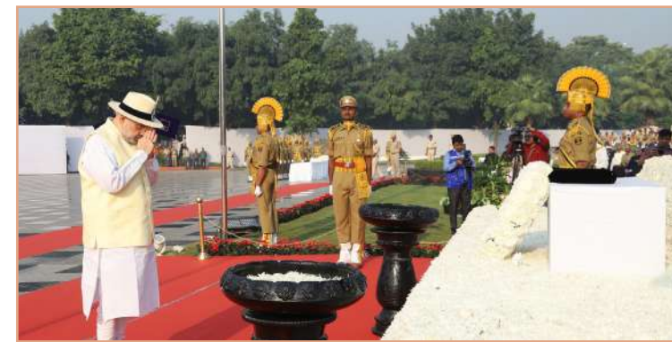
माननीय केंद्रीय गृह एवं सहकारिता मंत्री, श्री अमित शाह जी शहीदों को पुष्प श्रद्धांजलि अर्पित करते हुए