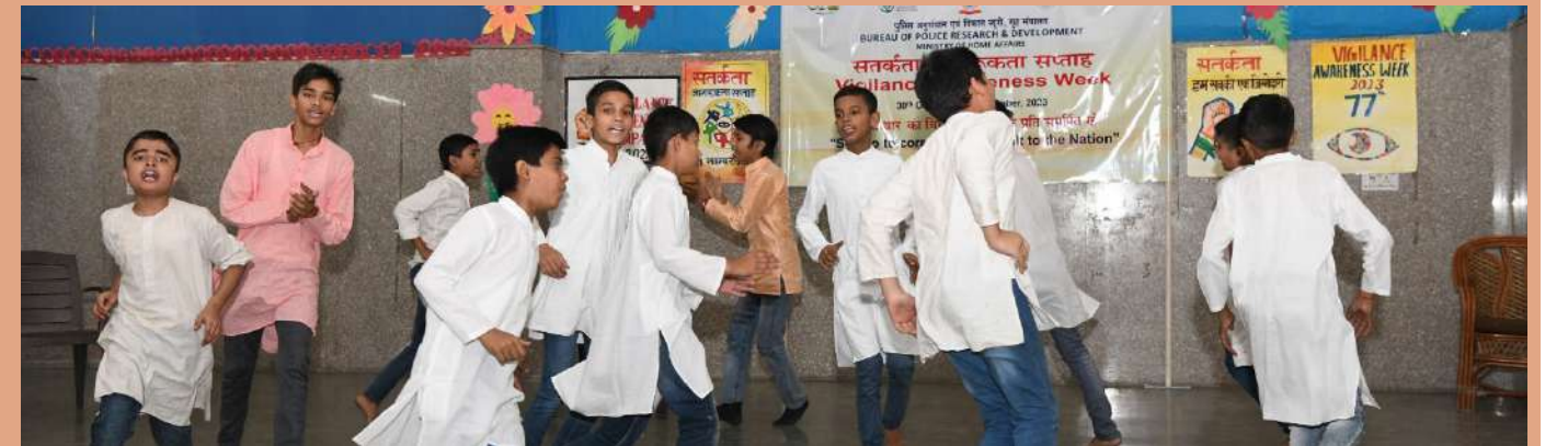
बॉयज सीनियर सेकेंडरी स्कूल, महिपालपुर के बच्चे लघु नाटिका के दौरान