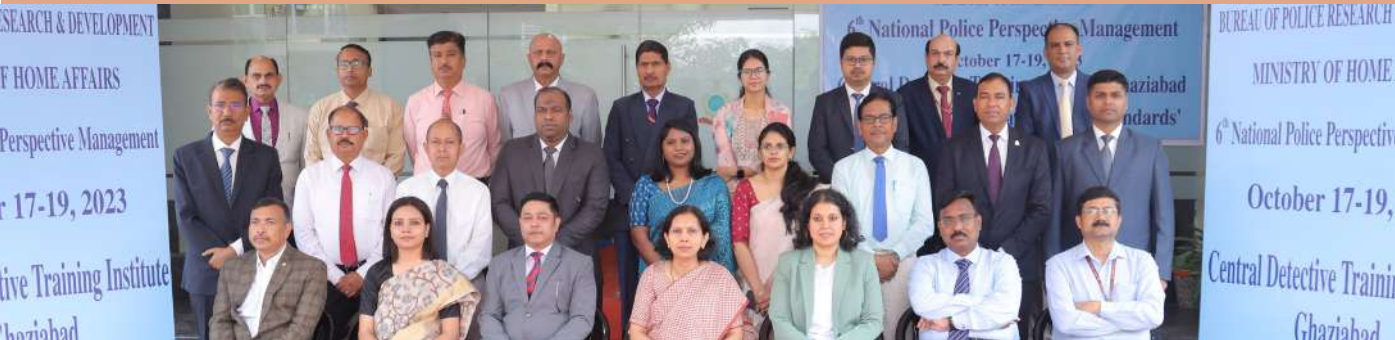
छठे राष्ट्रीय पुलिस परिप्रेक्ष्य प्रबंधन कोर्स में उपस्थित अधिकारियों एवं प्रतिभागियों का समूह फोटोग्राफ