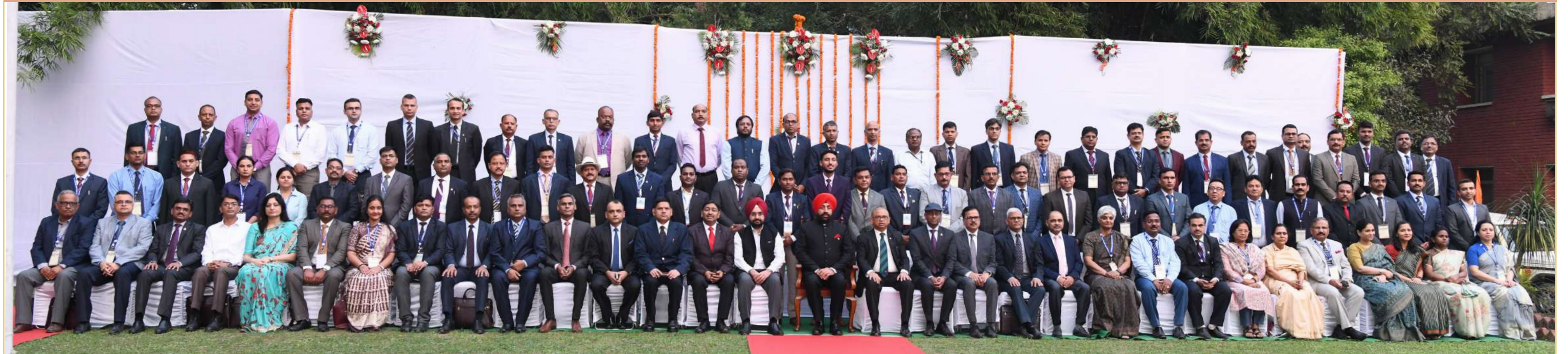
मुख्य अतिथि, माननीय राज्यपाल, उत्तराखंड, लेफ्टिनेंट जनरल गुरमीत सिंह, PVSM, UYSM, AVSM, VSM (सेवानिवृत्त), 49वीं अखिल भारतीय पुलिस विज्ञान कांग्रेस के प्रतिभागियों के साथ (समापन सत्र)