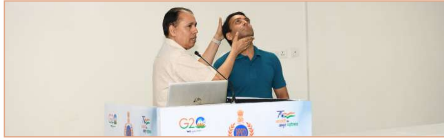
सीपीआर और प्राथमिक चिकित्सा प्रक्रियाओं पर एक प्रदर्शन

दिनांक 12 अक्टूबर, 2023 को बीपीआरएंडडी के आधुनिकीकरण प्रभाग के 'जीवन विज्ञान विंग' ने भारतीय रेड क्रॉस सोसाइटी के सहयोग से सीपीआर और प्राथमिक चिकित्सा प्रक्रियाओं पर एक प्रदर्शन एवं व्याख्यान आयोजित कराया। प्रदर्शन में बीपीआरएंडडी के लगभग 100 कर्मचारी एवं अधिकारी उपस्थित रहे। ●