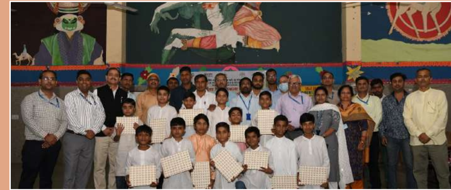
बॉयज सीनियर सेकेंडरी स्कूल, महिपालपुर के बच्चे एवं ब्यूरो के अधिकारी और कर्मचारी

आम जन को भ्रष्टाचार के विरुद्ध सतर्क करने के लिए लघु नाटिका का आयोजन