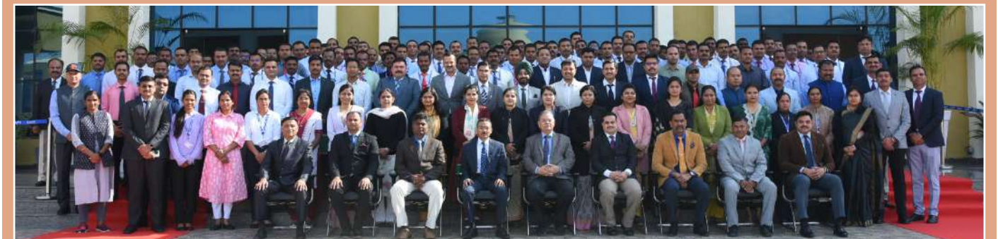
2-दिवसीय युवा पुलिस उपाधीक्षकों के तीसरे राष्ट्रीय सम्मेलन का समूह फोटोग्राफ