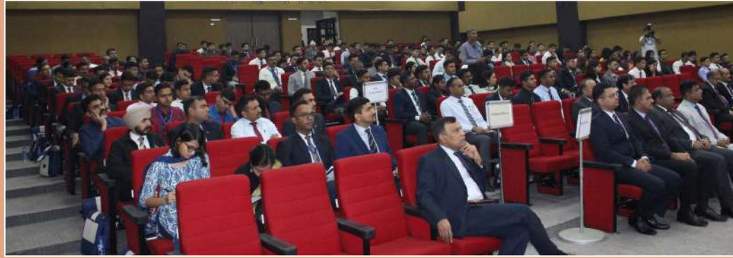
कार्यक्रम में उपस्थित वरिष्ठ अधिकारीगण एवं IPS Probationers