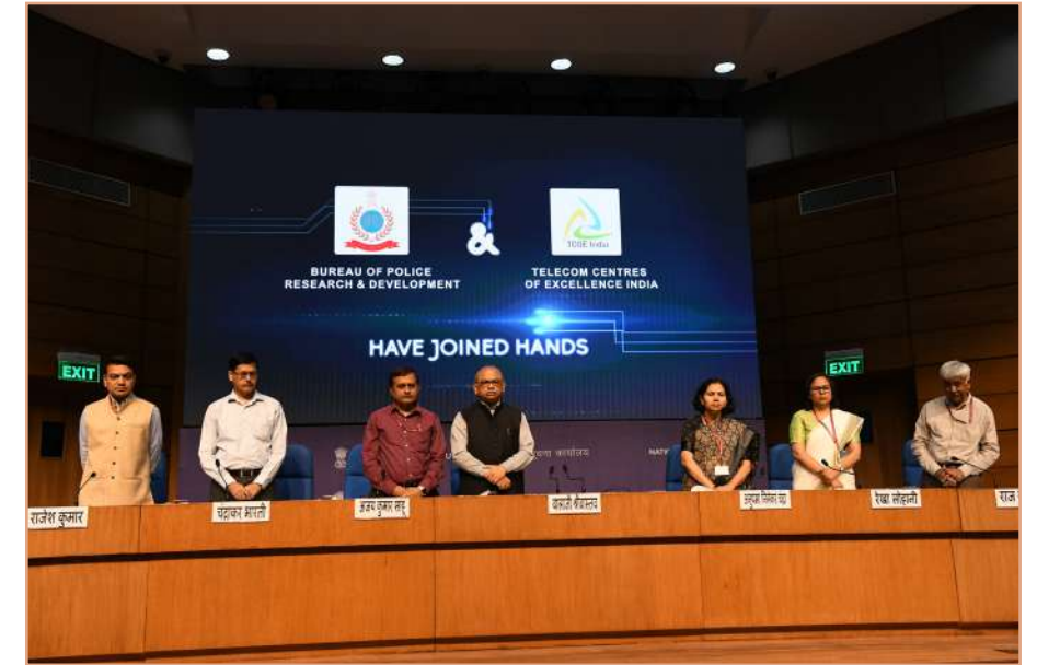
महानिदेशक, बीपीआरएंडडी एवं वरिष्ठ अधिकारीगण, 5जी पर राष्ट्रीय स्तर के हैकथॉन, 'विमर्श-2023' के उद्घाटन के दौरान