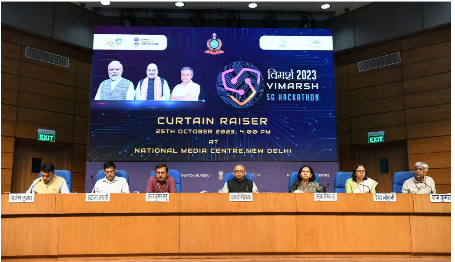
5जी पर राष्ट्रीय स्तर के हैकथॉन, 'विमर्श 2023' का उद्घाटन