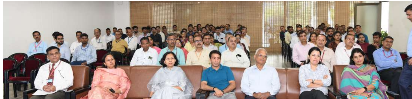
वरिष्ठ अधिकारीगण एवं कार्मिक, सीपीआर और प्राथमिक चिकित्सा प्रक्रियाओं पर प्रदर्शन एवं व्याख्यान के दौरान

दिनांक 17 अक्टूबर, 2023 को प्रशिक्षण विभाग, पुलिस अनुसंधान एवं विकास ब्यूरो द्वारा 03 दिवसीय (17-19 अक्टूबर, 2023), छठे 'राष्ट्रीय पुलिस परिप्रेक्ष्य प्रबंधन कोर्स' का आयोजन केंद्रीय गुप्तचर प्रशिक्षण संस्थान, गाजियाबाद में किया गया। जिसका उद्घाटन ब्यूरो की अपर महानिदेशक द्वारा किया गया। ●