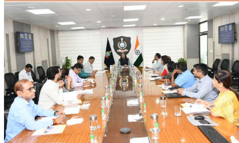
उप निदेशक (एसपीडी), बीपीआरएंडडी, नराकास, दक्षिण दिल्ली-। के नोडल कार्यालयों के अधिकारियों से चर्चा करते हुए

दिनांक 26 अक्टूबर, 2023 को ब्यूरो मुख्यालय में नगर राजभाषा कार्यान्वयन समिति (न.रा. का.स.), दक्षिण दिल्ली-। के नोडल कार्यालयों की बैठक आयोजित की गई, जिसमें आगामी छमाही बैठक को और अधिक सार्थक बनाने पर विस्तार से चर्चा की गई। ●