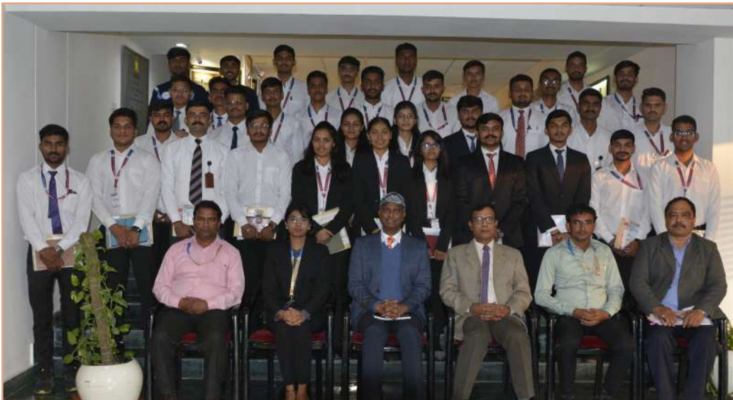
निदेशक (आर एंड सीए), उपनिदेशक (एसपीडी) एवं राष्ट्रीय रक्षा शक्ति यूनिवर्सिटी, गांधीनगर के छात्रों और फैकल्टी मेंबर का समूह फोटोग्राफ

राष्ट्रीय रक्षा शक्ति यूनिवर्सिटी गांधीनगर छात्रों तथा फैकल्टी मेंबर का बीपीआरएंडडी मुख्यालय में भ्रमण