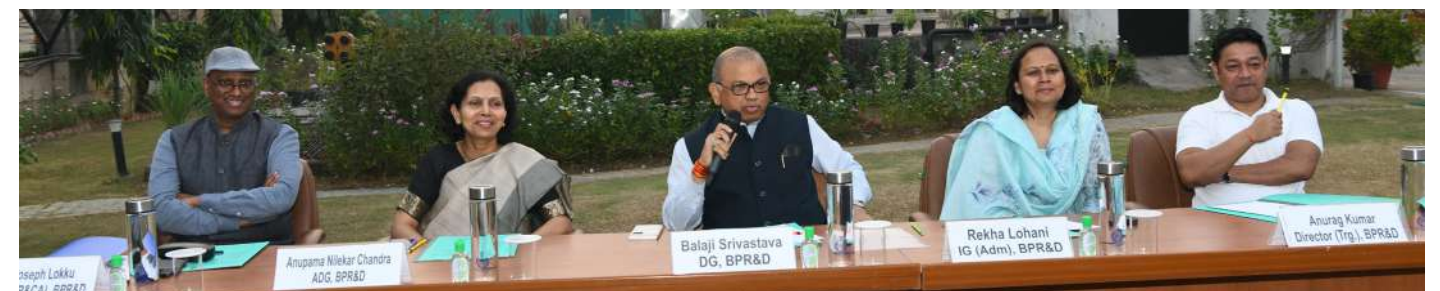
महानिदेशक महोदय संपर्क सभा की अध्यक्षता करते हुए