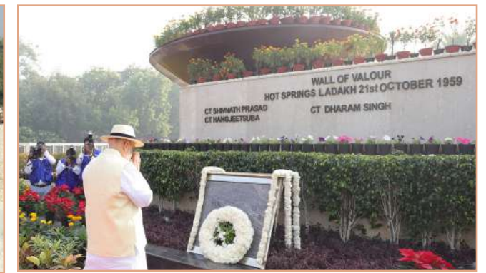
माननीय केंद्रीय गृह एवं सहकारिता मंत्री, श्री अमित शाह जी शहीदों को पुष्प चक्र और श्रद्धांजलि अर्पित करते हुए