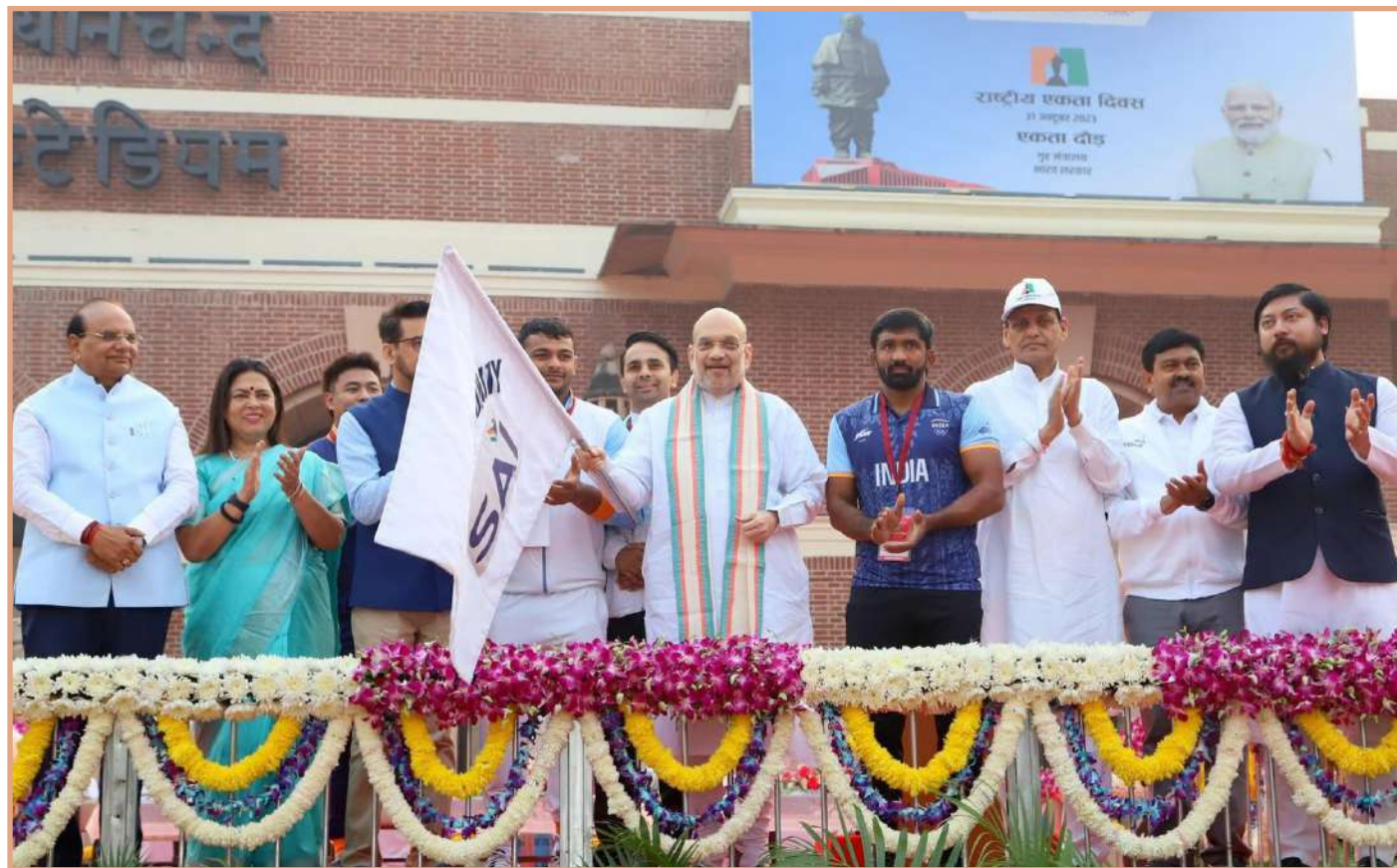
माननीय केंद्रीय गृह एवं सहकारिता मंत्री, श्री अमित शाह जी द्वारा राष्ट्रीय एकता दिवस पर आयोजित एकता दौड़ का शुभारंभ दिनांक 31 अक्टूबर, 2023 को मेजर ध्यानचंद राष्ट्रीय स्टेडियम, नई दिल्ली में किया गया