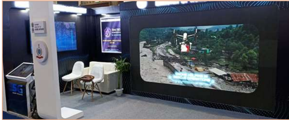
गृह मंत्रालय की ओर से 5जी प्रौद्योगिकी के प्रदर्शन के लिए बनाए गए बीपीआरएंडडी स्टॉल का फोटो