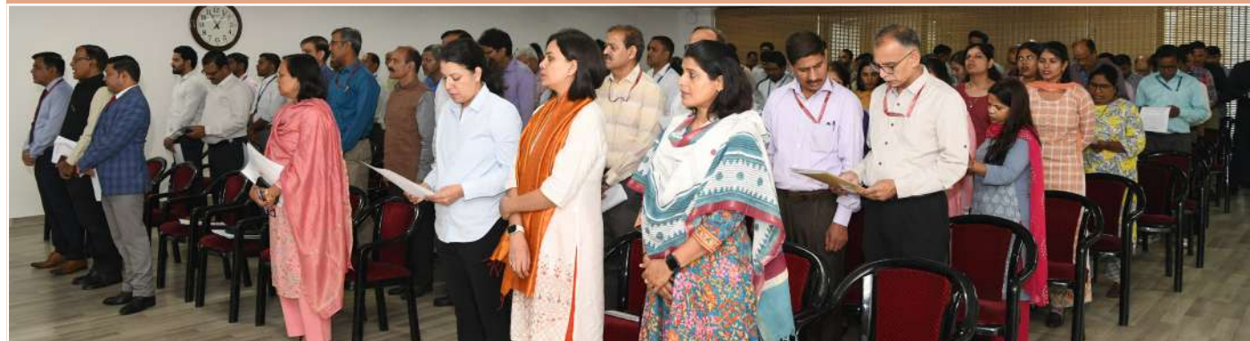
ब्यूरो मुख्यालय के अधिकारी एवं कार्मिक सतर्कता जागरूकता सप्ताह की शपथ लेते हुए