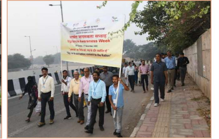
भ्रष्टाचार के खिलाफ लोगों में जागरूकता फैलाने के लिए एक वॉकथॉन

दिनांक 03 नवंबर, 2023 को ब्यूरो मुख्यालय ने सतर्कता जागरूकता सप्ताह के अंतर्गत बॉयज सीनियर सेकेंडरी स्कूल, महिपालपुर के सहयोग से आम जन को भ्रष्टाचार के विरुद्ध सतर्क करने के लिए लघु नाटिका का आयोजन किया। ●