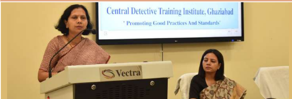
अपर महानिदेशक, बीपीआरएंडडी, छठे 'राष्ट्रीय पुलिस परिप्रेक्ष्य प्रबंधन कोर्स' में उपस्थित अधिकारियों को संबोधित करते हुए

दिनांक 17 अक्टूबर, 2023 को प्रशिक्षण विभाग, पुलिस अनुसंधान एवं विकास ब्यूरो द्वारा 03 दिवसीय (17-19 अक्टूबर, 2023), छठे 'राष्ट्रीय पुलिस परिप्रेक्ष्य प्रबंधन कोर्स' का आयोजन केंद्रीय गुप्तचर प्रशिक्षण संस्थान, गाजियाबाद में किया गया। जिसका उद्घाटन ब्यूरो की अपर महानिदेशक द्वारा किया गया। ●