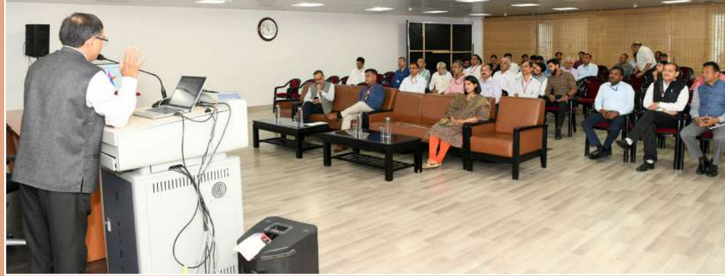
अतिथि वक्ता आयुर्वेद किट की उपयोगिता बताते हुए