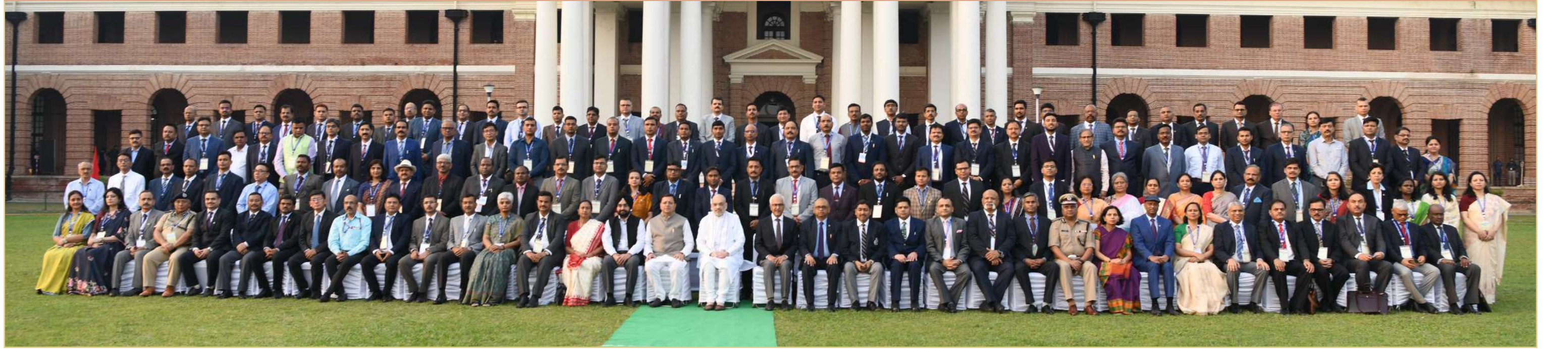
मुख्य अतिथि, माननीय केंद्रीय गृह एवं सहकारिता मंत्री, श्री अमित शाह जी, 49वीं अखिल भारतीय पुलिस विज्ञान कांग्रेस के प्रतिभागियों के साथ (उद्घाटन समारोह)