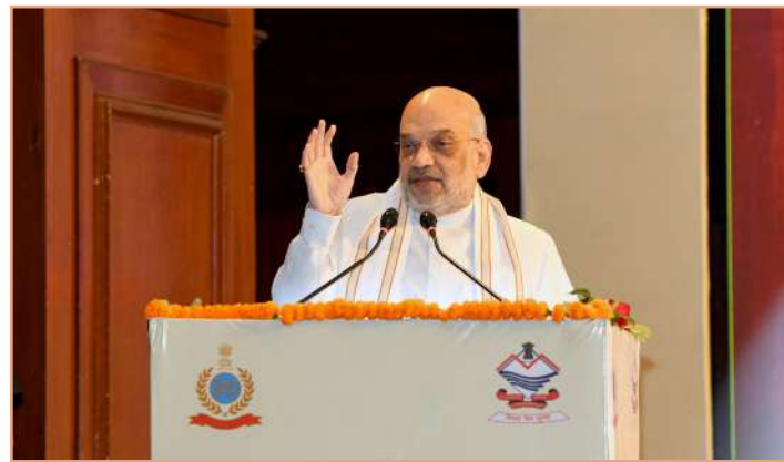
मुख्य अतिथि, माननीय केंद्रीय गृह एवं सहकारिता मंत्री, श्री अमित शाह जी प्रतिभागियों को संबोधित करते हुए