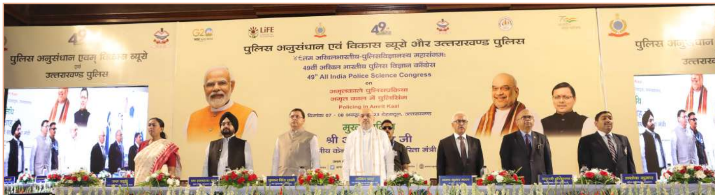
मुख्य अतिथि, माननीय केंद्रीय गृह एवं सहकारिता मंत्री, श्री अमित शाह जी एवं वरिष्ठ अधिकारीगण राष्ट्रगान के दौरान