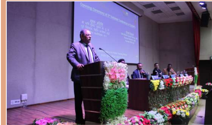
निदेशक, सीबीआई (सेवानिवृत्त), श्री ऋषि कुमार शुक्ला जी प्रतिभागियों को संबोधित करते हुए

2-दिवसीय युवा पुलिस उपाधीक्षकों का तीसरा राष्ट्रीय सम्मेलन 21 और 22 दिसम्बर 2023 को केंद्रीय पुलिस प्रशिक्षण अकादमी, भोपाल में आयोजित किया गया जिसमें देश भर से 80 से अधिक पुलिस अधिकारियों ने भाग लिया। इस अवसर पर निदेशक, सीबीआई (सेवानिवृत्त), श्री ऋषि कुमार शुक्ला ने मुख्य अतिथि के रूप में इस सम्मेलन की शोभा बढ़ाई। ●