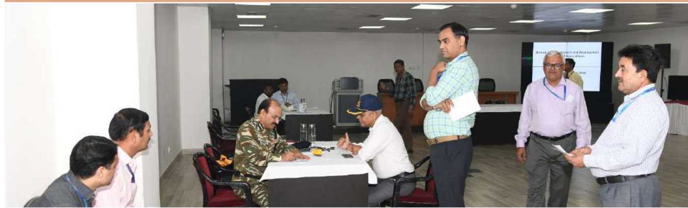
बीपीआरएंडडी के अधिकारी एवं कर्मचारी विशेष चिकित्सा शिविर के दौरान