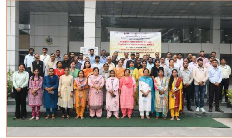
सतर्कता जागरूकता सप्ताह के दौरान बीपीआरएंडडी के अधिकारी एवं कर्मचारी

दिनांक 02 नवंबर, 2023 को बीपीआरएंडडी ने महिपालपुर, नई दिल्ली के स्थानीय क्षेत्र में सतर्कता जागरूकता सप्ताह के दौरान भ्रष्टाचार के खिलाफ लोगों में जागरूकता फैलाने के लिए एक वॉकथॉन का आयोजन किया। ●