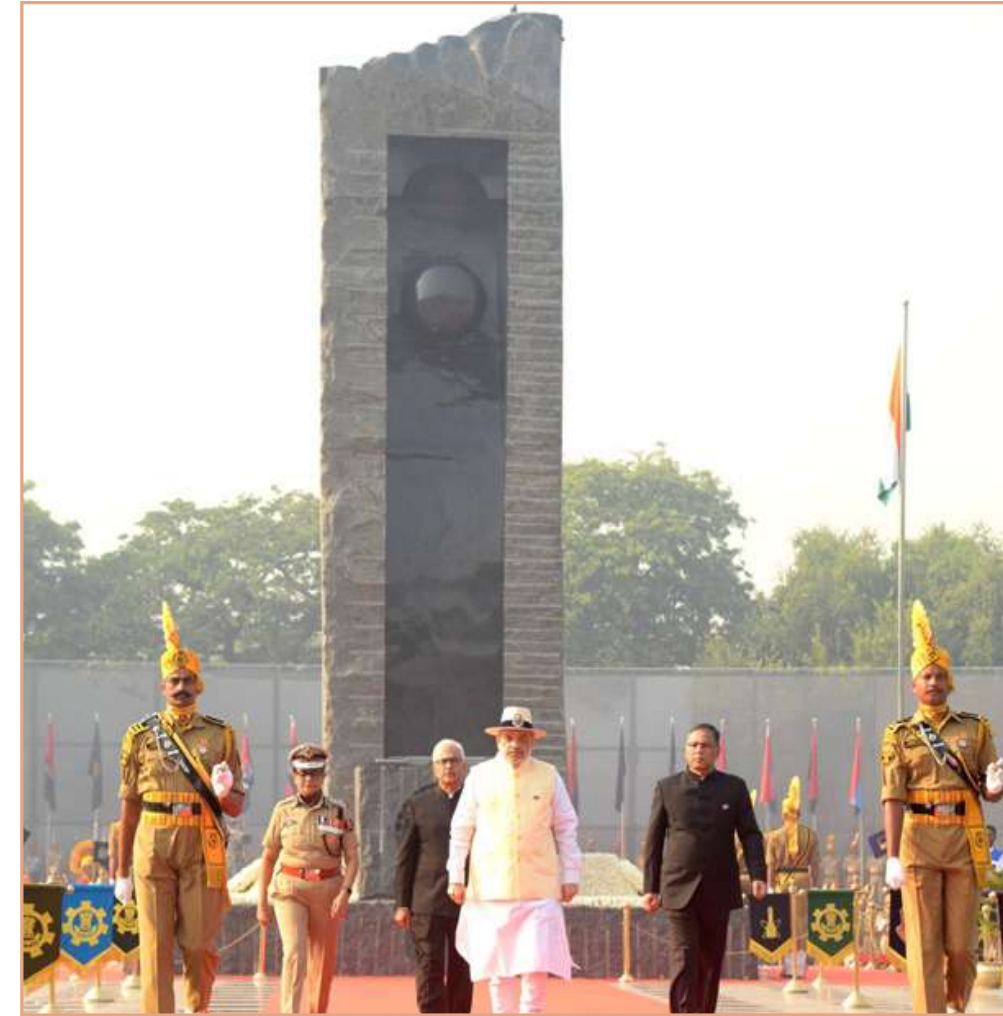
माननीय केंद्रीय गृह एवं सहकारिता मंत्री, श्री अमित शाह जी 'राष्ट्रीय पुलिस स्मारक' परेड के दौरान

दिनांक 21 अक्टूबर, 2023 को 'पुलिस स्मृति दिवस परेड' का आयोजन देश के सभी पुलिस कार्यालयों में आयोजित किया गया। मुख्य परेड, 'राष्ट्रीय पुलिस स्मारक' पर आयोजित की गई जिसमें माननीय केंद्रीय गृह एवं सहकारिता मंत्री, श्री अमित शाह जी शामिल हुए तथा उन्होंने शहीदों को पुष्प चक्र अर्पित कर अपनी भावभीनी श्रद्धांजलि अर्पित की। ब्यूरो मुख्यालय एवं बाह्य यूनिटों में इस कार्यक्रम का सीधा प्रसारण आयोजित किया गया। ●