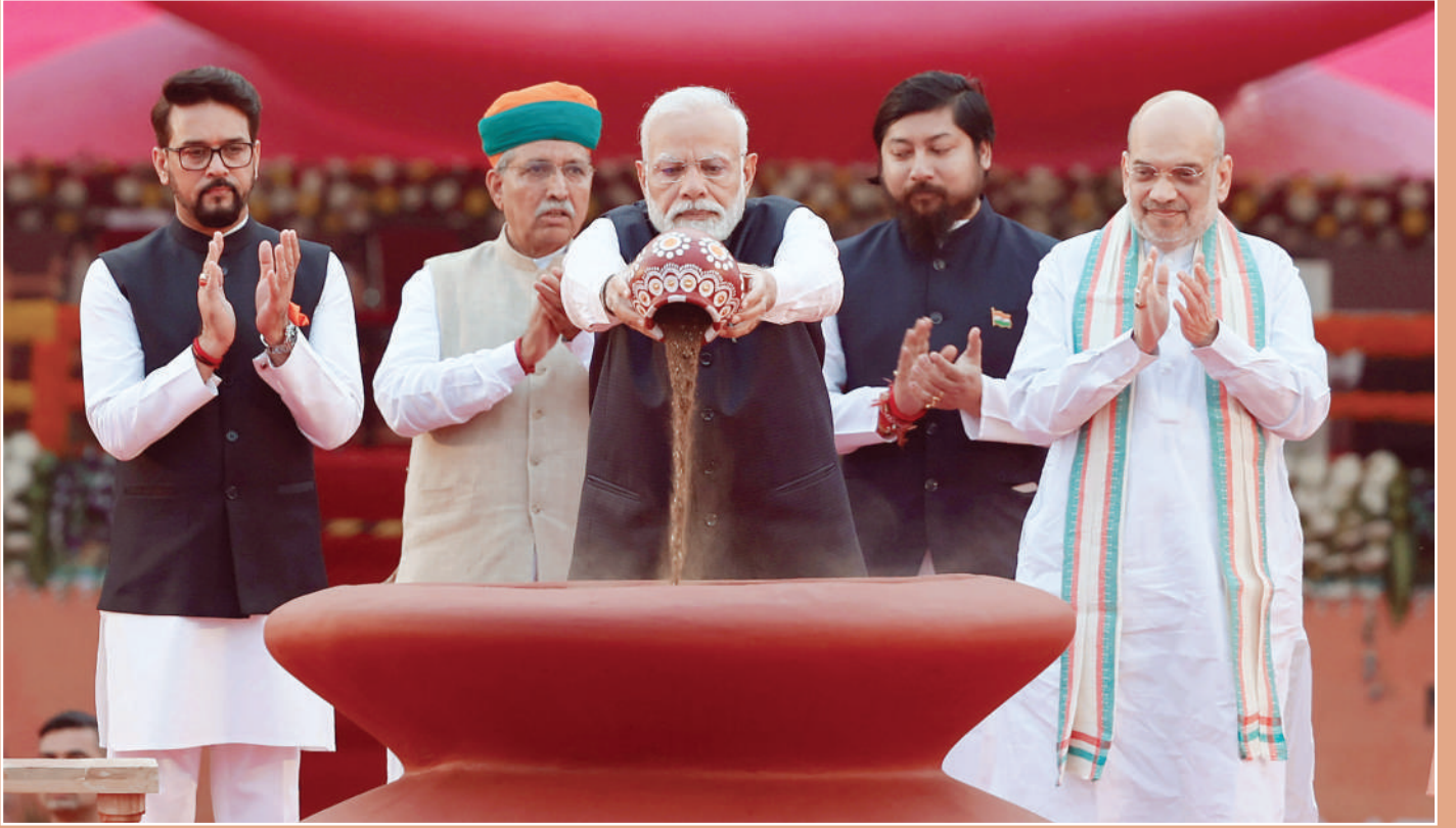
‘मेरी माटी मेरा देश’ : विकसित भारत का लक्ष्य प्राप्त करने के लिए प्रेरक पहल