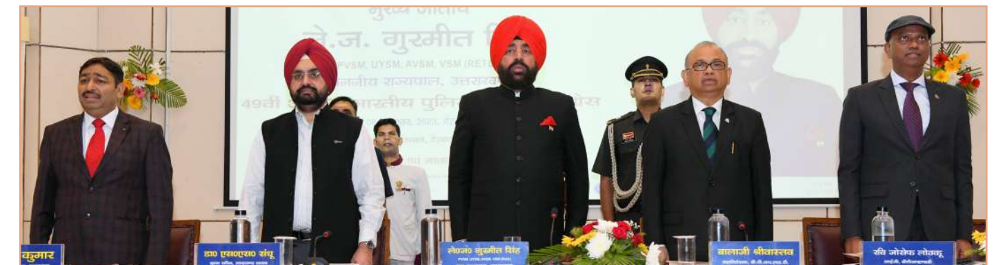
मुख्य अतिथि, माननीय राज्यपाल, उत्तराखंड, मुख्य सचिव, उत्तराखंड, महानिदेशक, बीपीआरएंडडी, पुलिस महानिदेशक, उत्तराखंड और निदेशक (आर&सीए/कॉन्फ्रेंस सेक्रेटरी) राष्ट्रगान के दौरान