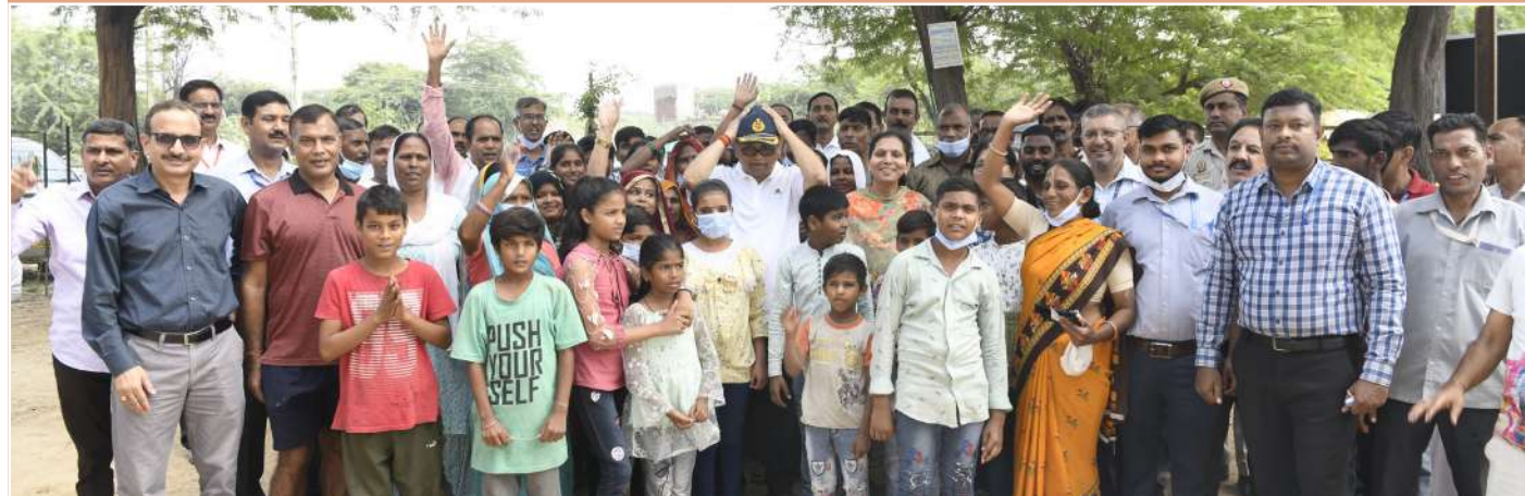
ब्यूरो के अधिकारी एवं कार्मिक और क्षेत्र के आम जन स्वच्छता अभियान के दौरान