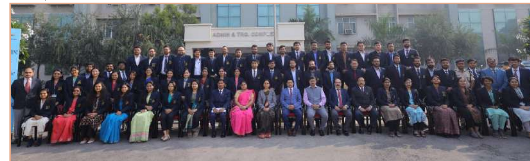
बीपीआरएंडडी के वरिष्ठ अधिकारीगण एवं आईआरएस (प्रशिक्षु) 76वें बैच के अधिकारियों का समूह फोटोग्राफ